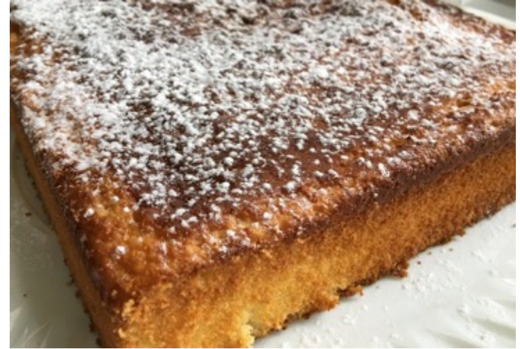
PANQUÉ DE ELOTE $340