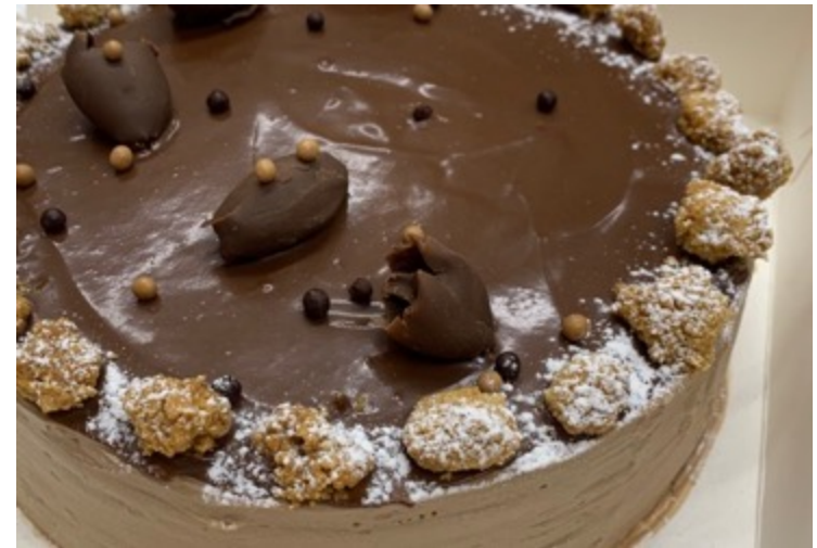
CREPAS CON GANACHE DE CHOCOLATES $480