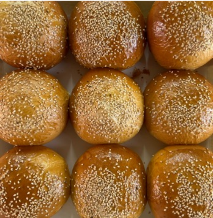
9 BRIOCHE PARA HAMBURGUESA $120