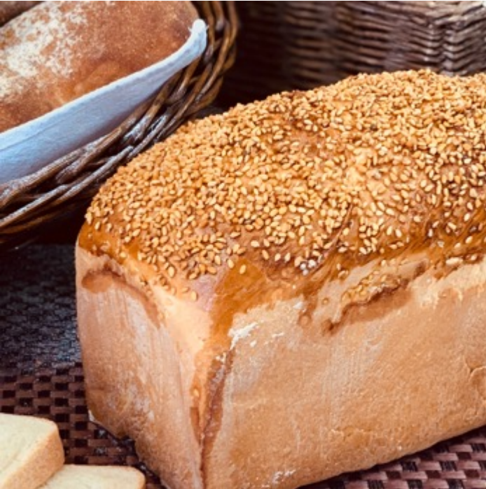
PAN DE CAJA $60