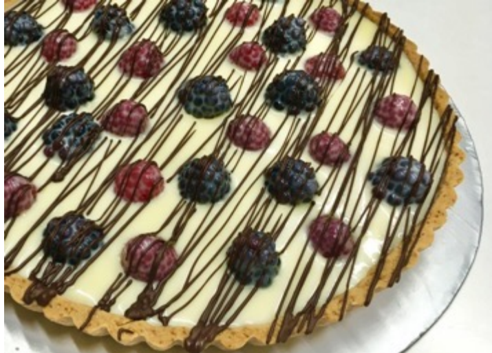
TARTA CHOCOLATE BLANCO $500