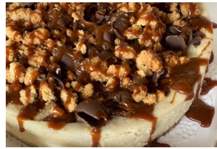
CHEESECAKE CRUMBLE Y CARAMELO $500