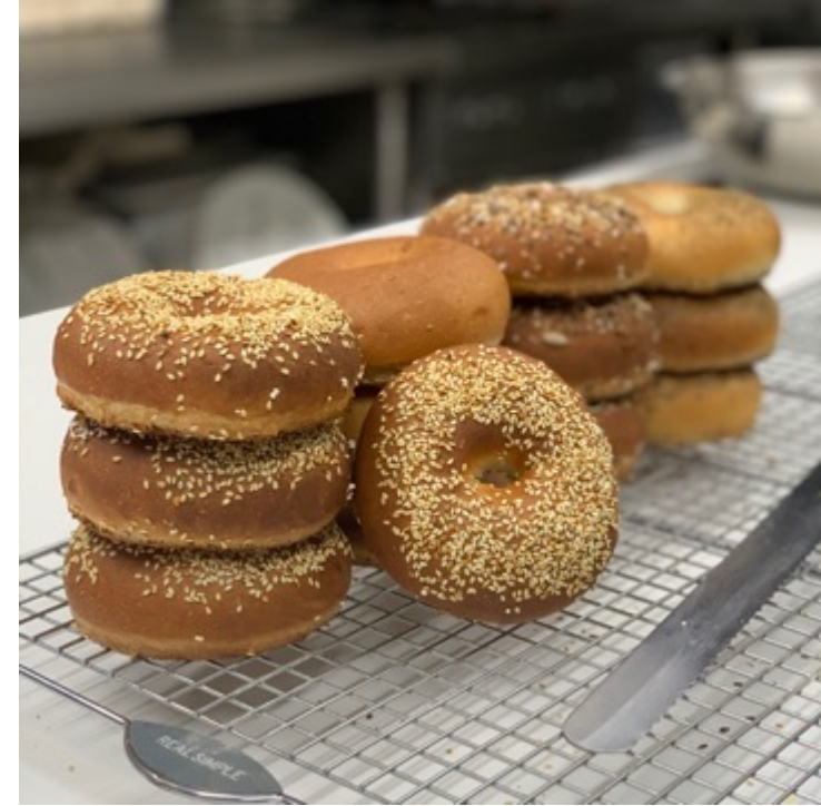
BAGEL PAQUETE 8 PIEZAS DEL MISMO SABOR NATURAL, AJONJOLÍ, GRANOS, ESPECIAS