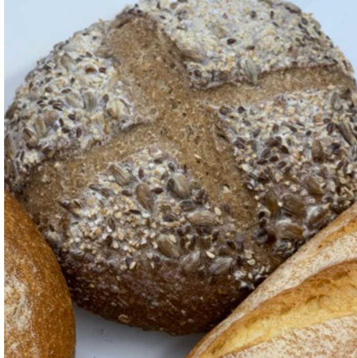
HOGAZA CON SEMILLAS $60