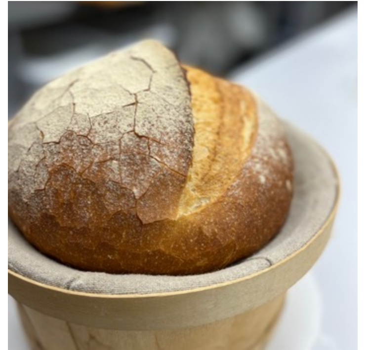
HOGAZA MASA MADRE $60