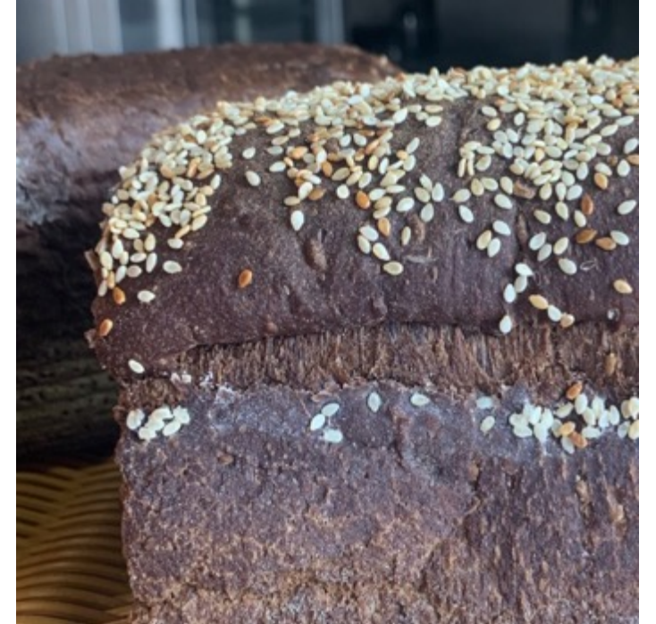
PAN DE CAJA DE CENTENO $60