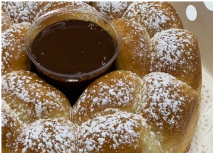
ROSCA BRIOCHE C/CHOCOLATE $320