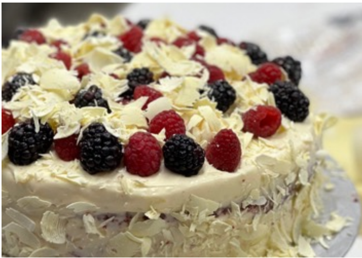
RED VELVET $480