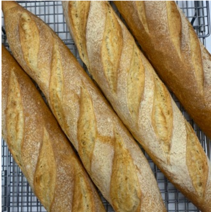
BAGUETTE (PAQUETE CON 2 PZS) $60