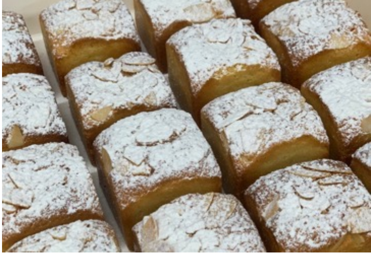
BIZCOCHO DE ALMENDRA $500 16 INDIVIDUALES