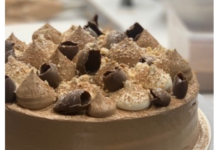
TRES CHOCOLATES $480