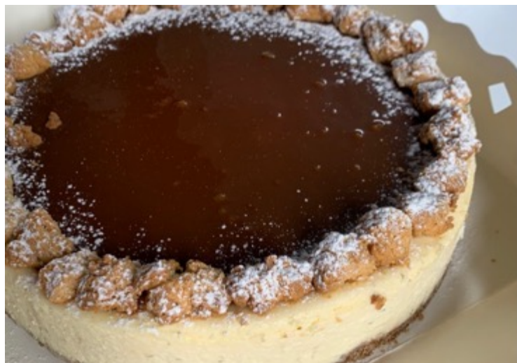
CHEESECAKE CAJETA $500