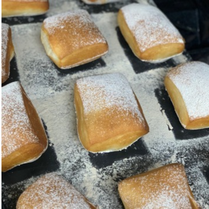
CHAPATA PAQUETE 8 PIEZAS